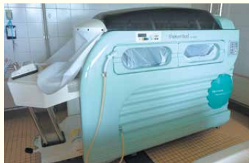
・ストレッチャー浴槽

実際に、入居者さまからも「よく温まって気持ちがいいのよ～」との声をいただいています。