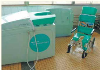
・チェアーイン浴槽