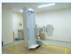
X線(レントゲン)透視装置